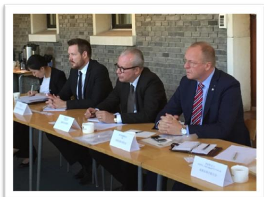
Möte på Ambassaden med China Meat Association.