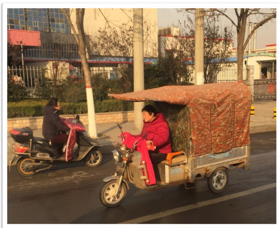
Vanligaste transportmedlet. Se de specialsydda hand- och benvärmarna.