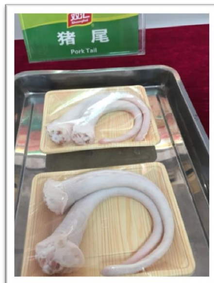
"The Golden Tail" i naturligt utseende!