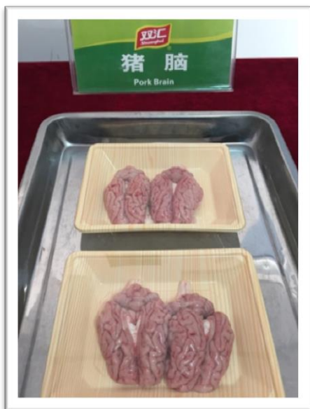
Delikatess i form av grishjärna.